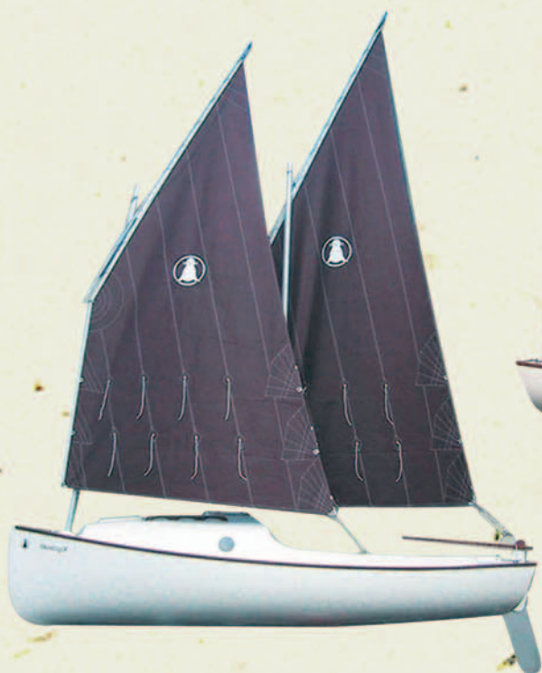
SKELLIG 2 la simplicité