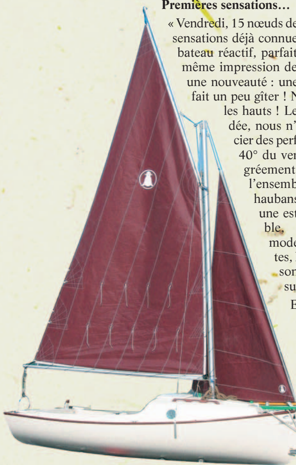
SKELLIG 2 SLOUP la Belle Plaisance

En version « côte », notre SKELLIG 2 est proposé avec trinquette endraillée sur étai avec mousquetons et foc sur bout-dehors.