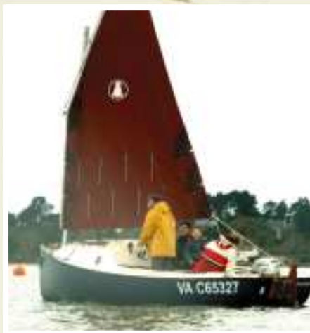
Moteur thermique 10 cv

2 bateaux en location sur la Sarthe - www.anjou-navigation.fr