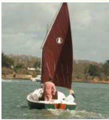
Moteur électrique 6 cv