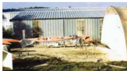
Premier atelier de sérent

« Je me souviens des premiers kayaks de mer achetés pour mon club de Pontivy : les tous premiers Catchiky .