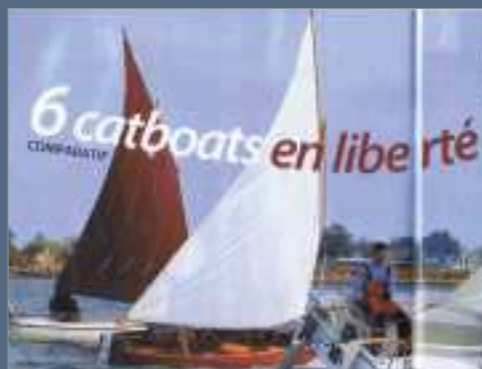
Voiles & Voiliers - juillet 07