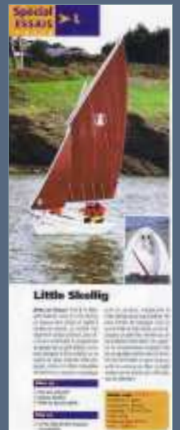
Bateaux - Août 07