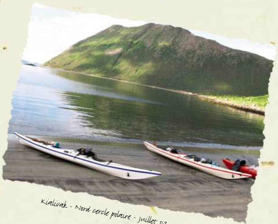
Kialivak - Nord cercle polaire - Juillet 07