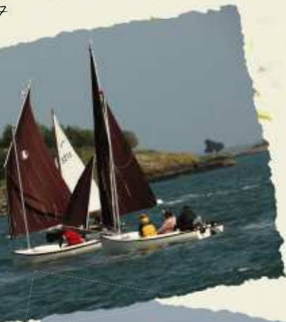
- semaine du Golfe -