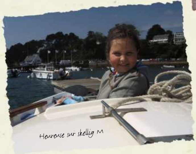
Heureuse sur skellig M