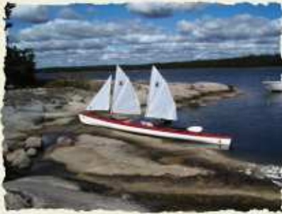
Bélonga 2 - Ile Ljusterö - suède - Août 07