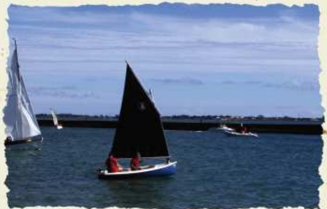
Little skellig - Noirmontier - Août 07