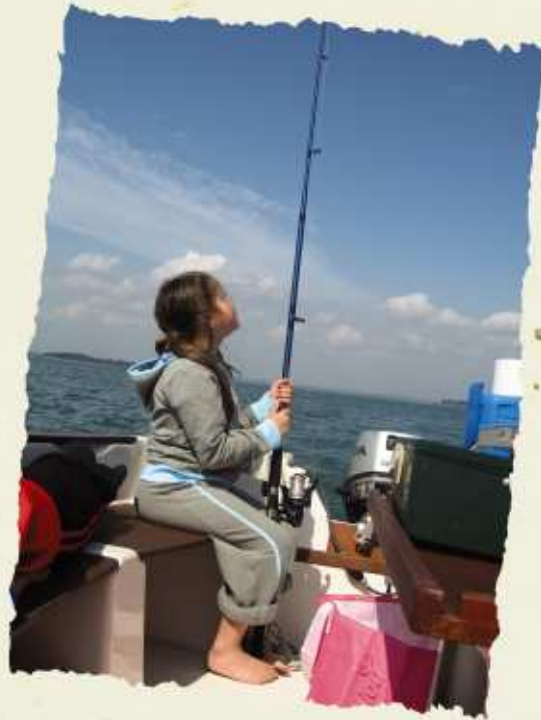
Jeune pêcheur sur skellig