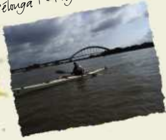
Bélonga 1 - Pays Bas - juin 07