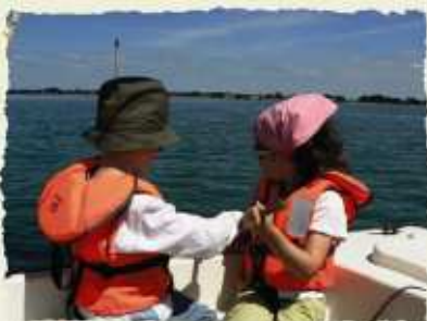
A la barre du skellig 1