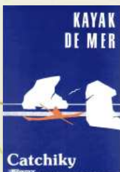
1 ère documentation