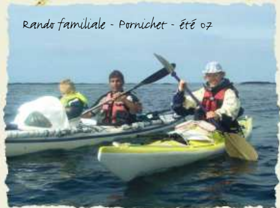
Rando familiale - Pornichet - Été 07