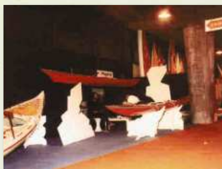
1 er salon nautique