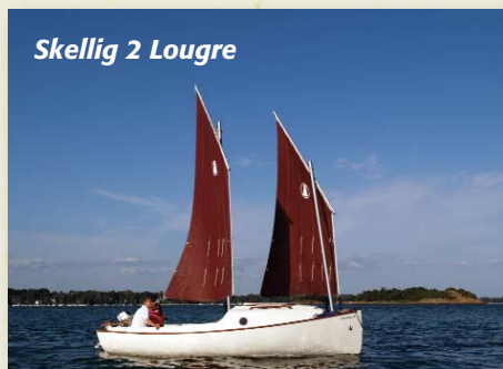
Skellig 2 Lougre

Elégance, caractère et silhouette traditionnelle, stabilité et sécurité, facilité de transport, cockpits très spacieux et surtout, la SIMPLICITÉ . Ils sont le meilleur rapport « plaisir/technique » : tout est simple. Débutant ou vieux loup de mer, plaisir garanti !